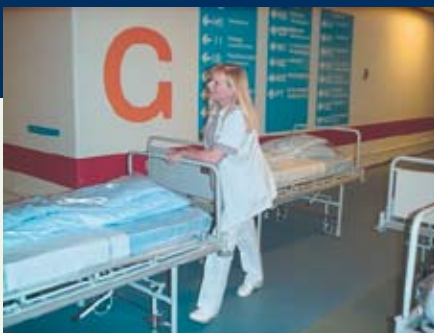
Portørfaget og arbejdsskader – en kendt cocktail i FOA

Man kan læse mere om mulighederne på www.forebyggelsesfonden.dk , og FOA 1 bistår gerne, hvis I på jeres arbejdsplads ønsker at søge midler til et projekt.