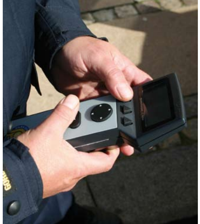
Med den lille terminal skrives bøderne ud på stedet.