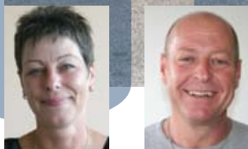
Tekst og billeder: Anette Lundshøj og Steen Vadgaard

I solskin og varmt vejr er det et skønt job at være P-vagt. Og så kan man jo gøre studier i følge!