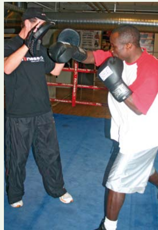
Som i boksning er overenskomstsforhandlingerne en kamp med mange regler.