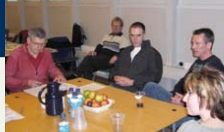
Tid til en hyggestund under gruppearbejdet.

I FOA 1 har vi ikke altid kursister nok til at fylde et hold op, og vi har derfor indgået et samarbejde med alle FOA-afdelingerne i Region Hovedstaden om ledige kursuspladser. Grunduddannelsen afholdes som regel i FOA 1, og FOA 1's afdelingsunderviser er en af de to undervisere på uddannelsen.